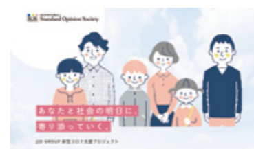
コロナ支援プロジェクト