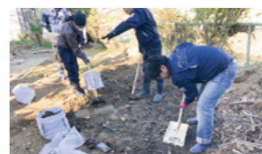
災害ボランティア活動