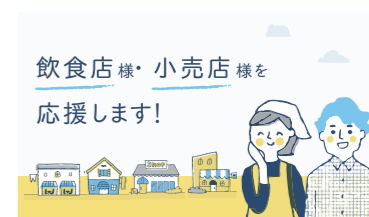
飲食店・小売店支援

その他、JID財団やNPO法人Standard Opinion Society(SOS)の設立など、人々が安心して生活できる社会環境を提供する企業として、さまざまな取り組みを行っています。また、JID GROUPの売上の一部は、支援を必要とする団体や被災地支援として寄付をさせていただいております。